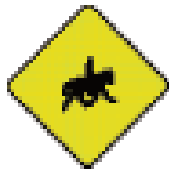
Сопровождаемые лошади и пони

Если Вы едете верхом или ведете лошадь, Вы должны держаться левого края дороги. Вам следует одеть хорошо видимый жакет и утвержденный шлем для верховой езды.