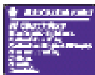
Впереди автомобильная магистраль

Нижеприведенные знаки появляются на подъезде к автомобильной магистрали или при въезде на нее. Знак слева содержит перечень лиц, которые не должны въезжать на автомобильную магистраль: