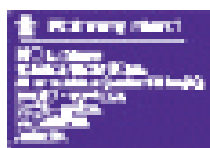
Впереди автомобильная магистраль