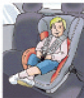
Foteliki mocowane przodem do kierunku jazdy

Przybliżony przedział wiekowy: od urodzenia do 12-15 miesięcy