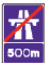
前方 500 米即将驶出高速公路