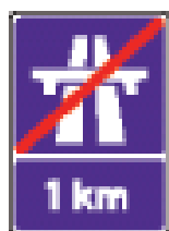
前方 1 公里即将驶出高速公路