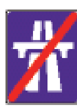
即将驶出高速公路