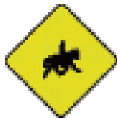
有看护的马匹和 小型马

如果您是在骑马或牵马，则 必须 靠近道路左缘。您 应该 身穿醒目的马甲，并戴经认可的骑马头盔。